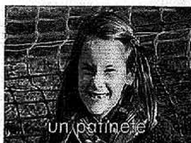
Personas de diferentes edades y profesiones expresan sus deseos.